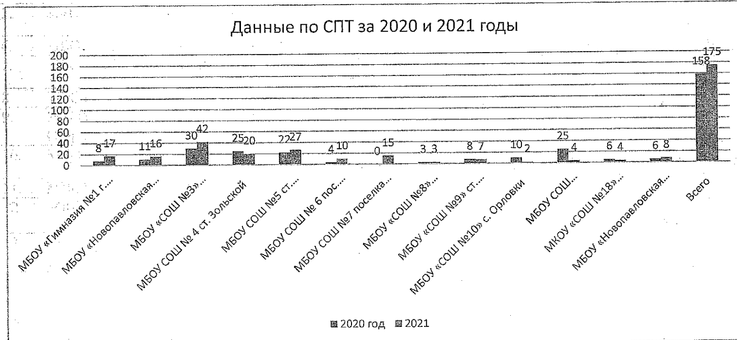
Данные по СПТ за 2020 и 2021 годы

Просим данную информацию принять к сведению. Провести анализ профилактических мероприятий с обучающимися 7 – х-11 – х классов, продолжить