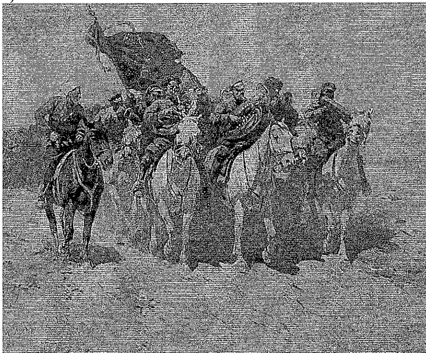
«Трубачи Первой конной»