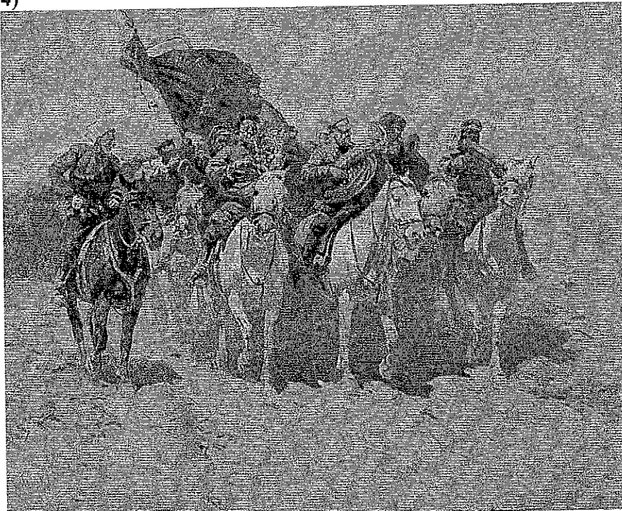
«Трубачи Первой конной»