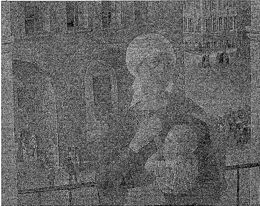
«1918 год в Петрограде»