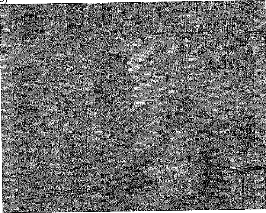
«1918 год в Петрограде»